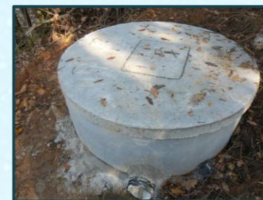
Encaminhamento de águas pluviais Rua do Norte