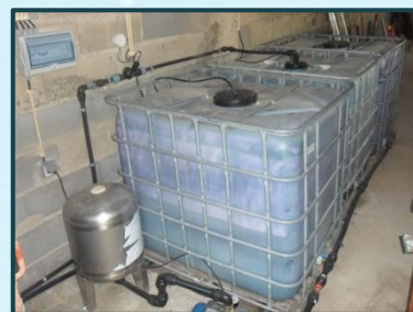
Colocação de depósitos de água no cemitério