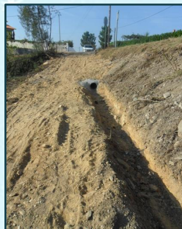
Desvio de águas pluviais Rua dos Caçadores