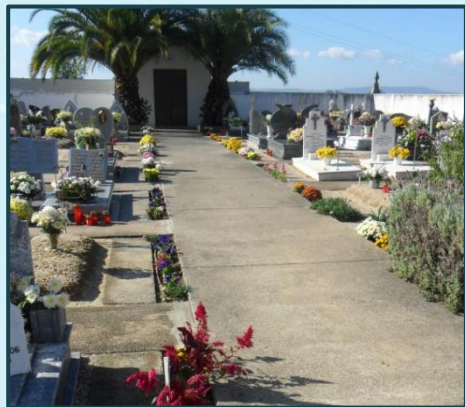
Limpeza do Cemitério