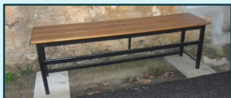
Reparação de bancos