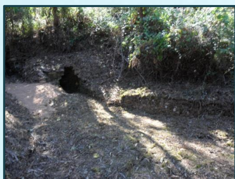
Limpeza da Fonte de Lagares