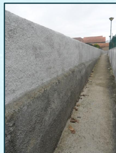
Reparação de muro Carreiro Senhora Remédios